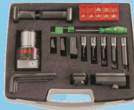
KIT K01 TRM 50/63 O 63/63 (Ø 6- 125 mm)