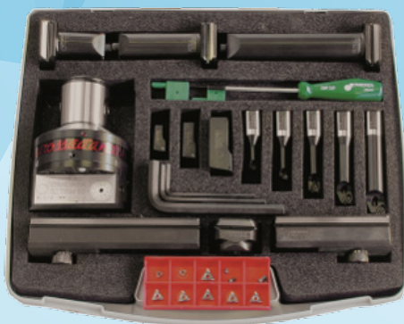
KIT K01 TRM 50/80 O 80/80 (Ø 6- 220mm)