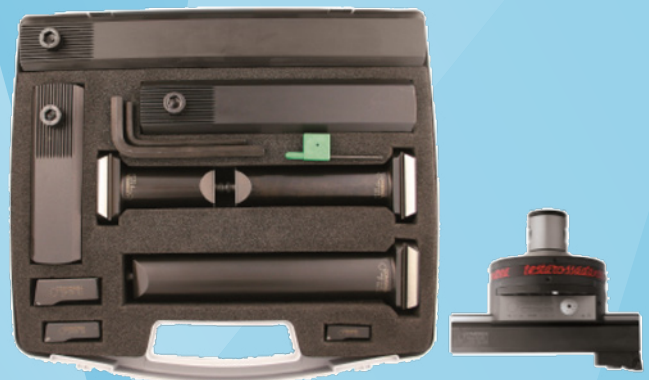
KIT K01 TRM 80/125 (Ø 36- 410mm)