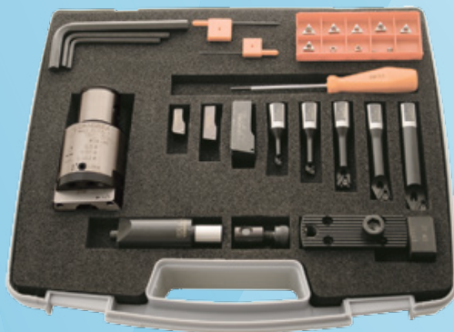
KIT K01 TRM 50/50 (Ø 6- 108 mm)